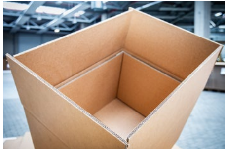
VERPACKUNGEN AUS WELLPAPPE